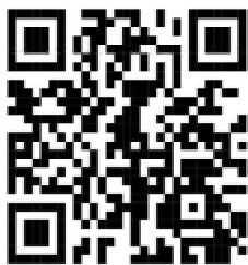
для перечисления в фонд «Светоч» через Сбербанк.

Для перечисления средств необходимо отсканировать QR-код через банковское приложение: