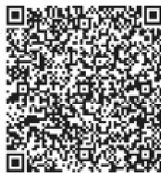
для перечисления в фонд «Светоч» через ВТБ